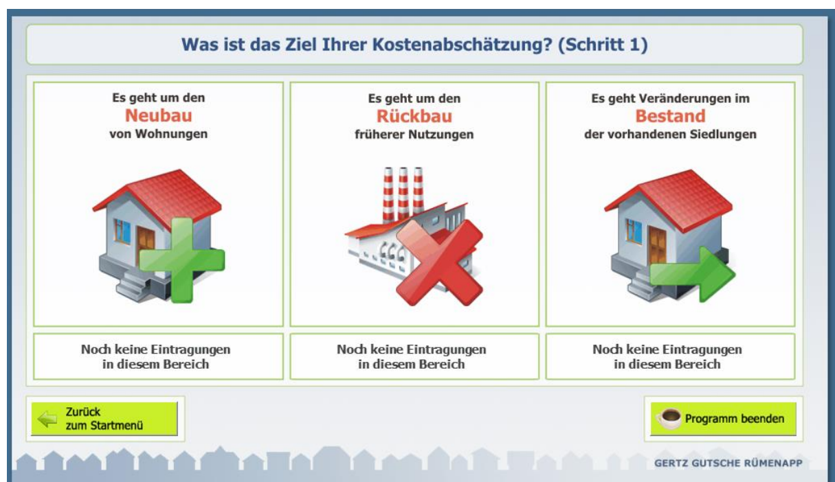
Abbildung 2 Themenfelder des FolgekostenSchätzers

Innerhalb dieser drei Themenfelder ist der FolgekostenSchätzer auf die folgenden fünf Anwendungsfälle zugeschnitten, die entsprechend ausgewählt werden können.